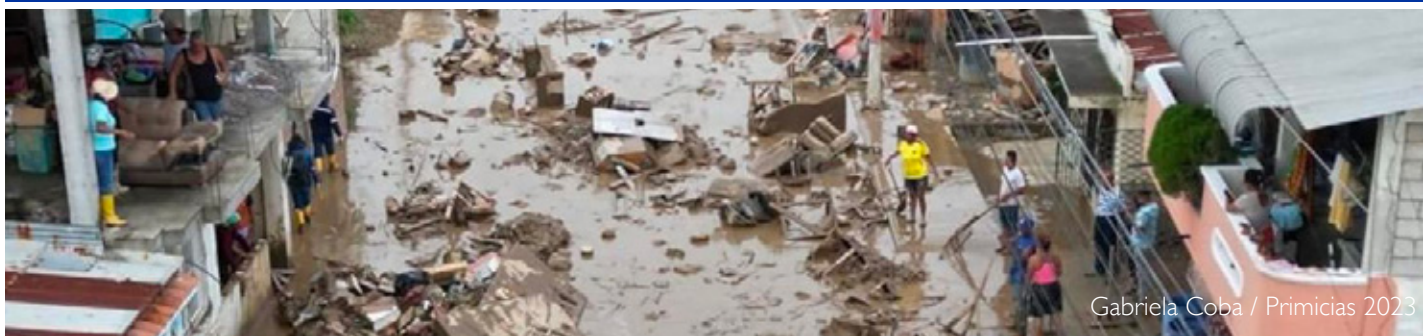
Gabriela Coba / Primicias 2023